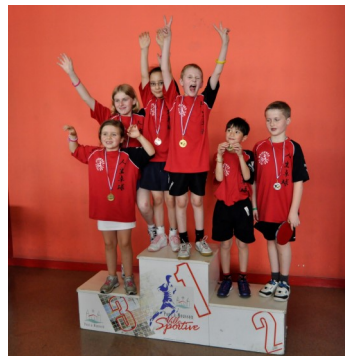
De nombreux podiums au Grand Prix des jeunes

Les programmes adaptés C'est avec un plaisir évident que les résidents des foyers de l'APFJ prennent possession des lieux. Nous les avons rencontrés. « Les résidents... »