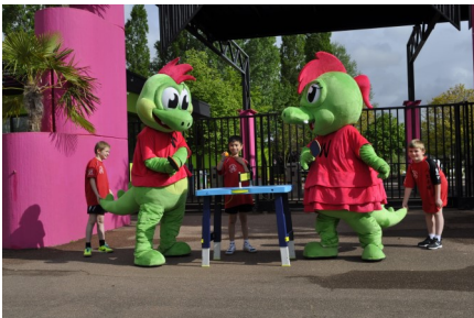
Waly Ping 2014 reconduit le 23 aout 2015

Le Tennis de Table de Maizières-Lès-Metz est heureux de vous accueillir. La dynamique du club en quelques chiffres et photos :