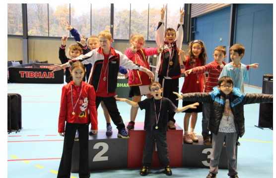
7 médailles au top départemental champion de Moselle benjamin 2014 et 2015 champion de Moselle Minime 2013 et 2015