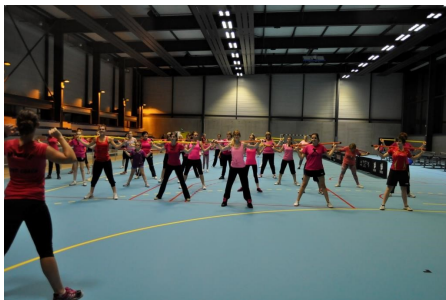
Fit Ping Tonic pour Octobre Rose