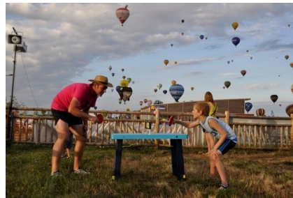
Le Ping survole Chambley