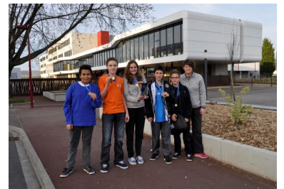
Champion de Moselle UNSS 2014 et 2015 Vice-champion d'académie 2014